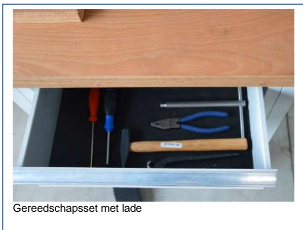
Gereedschapsset met lade