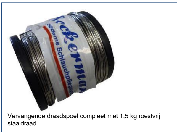
Vervangende draadspool compleet met 1,5 kg roestvrij staal draad